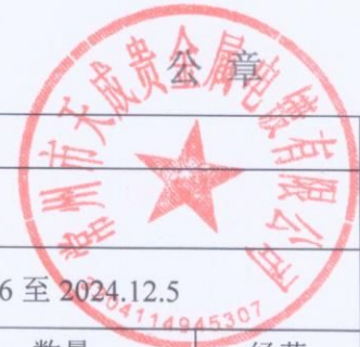
表1 接受单位基本情况